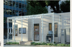
日本橋観光案内所