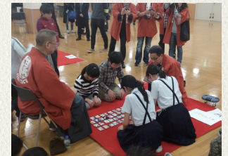
日本橋かるた大会

日本橋かるた大会の定期的開催、日本橋かるたの普及活動、各種歴史文化イベントの開催など