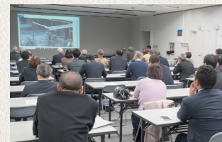
当委員会オリジナルセミナー