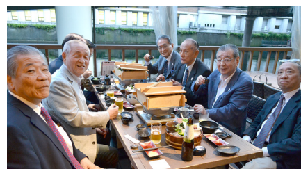
5月13日、幹事会の後、豊年萬福の“かわてらす”で自費による懇親会が開催された

私はお酒を飲まないのですが、みなさんと胸襟を開いて懇親を深めるのも、時にはいいですね。