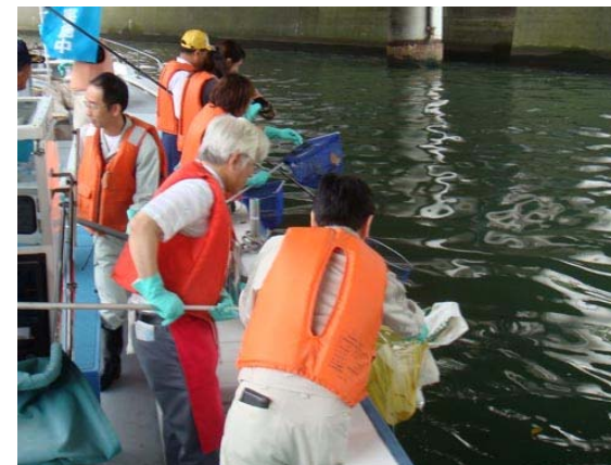
網ですくう人とゴミ袋に入れる人の共同作業です