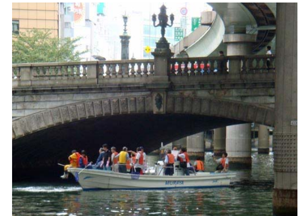
日本橋の下も清掃しました!