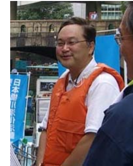
国土省 荒川専門官 挨拶