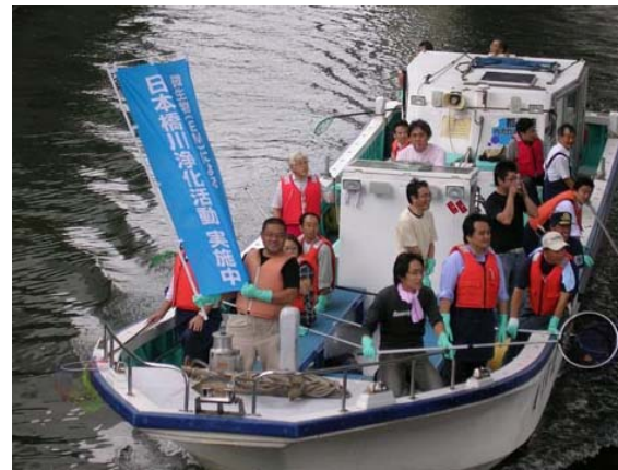
日本橋川浄化活動 実施中!