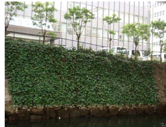
合間合間に景色を楽しみます