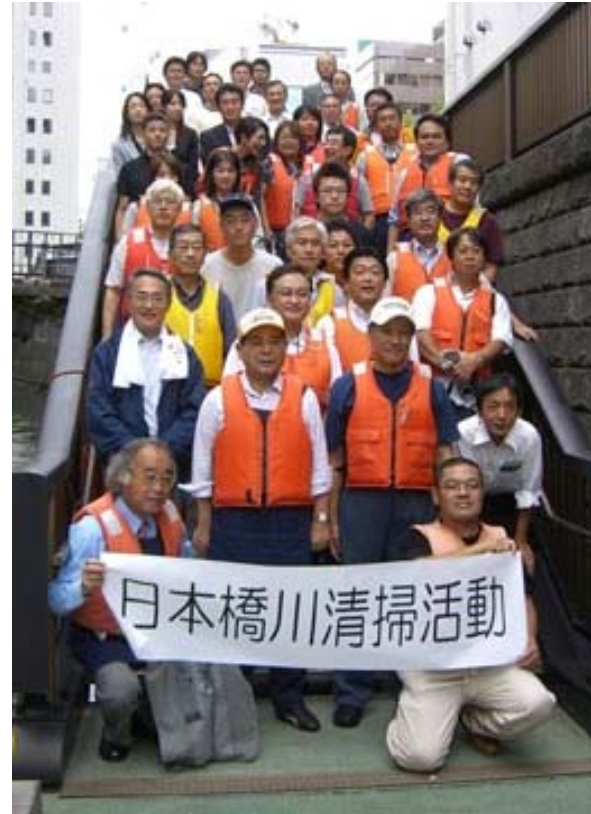
今回参加されたみなさんです