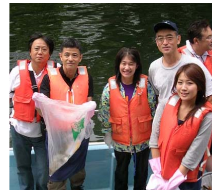
千代田区エリアの方も参加!