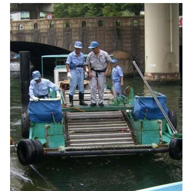
都の清掃船との協働