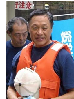
三井不動産 大室副社長 挨拶