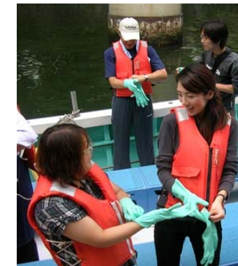
ゴム手袋で完全装備