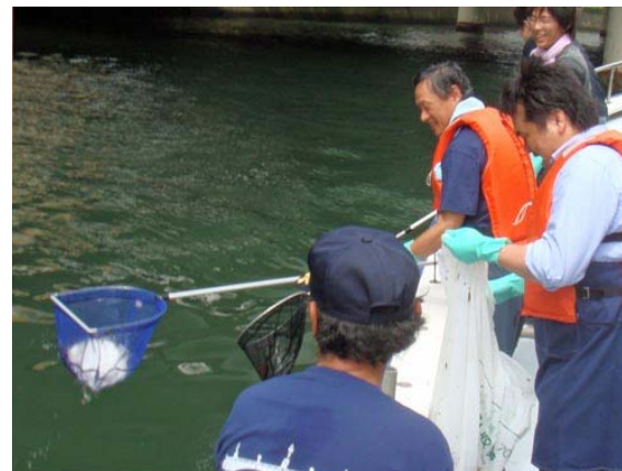
船から網でゴミをすくいます