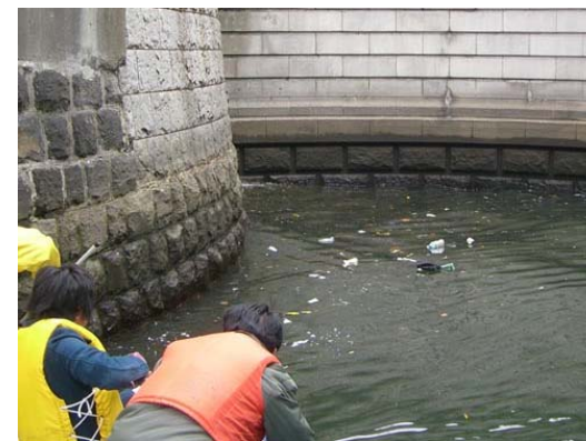
日本橋のたもとの窪んだところにはゴミが淀んでしまいます。