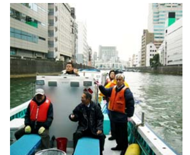
日本橋川下流には空が広がります。