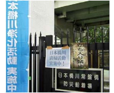
日本橋川浄化活動 実施中