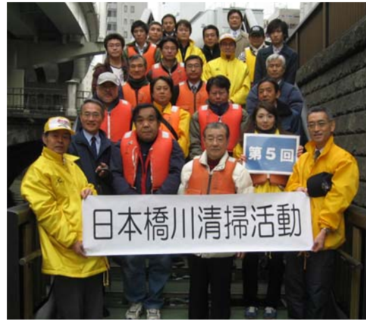
今回参加されたみなさんです