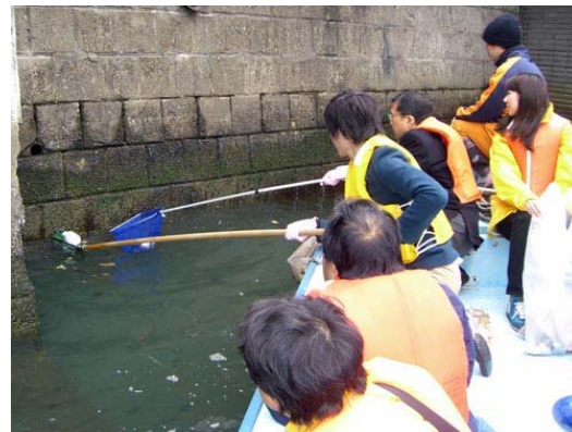
船から網でゴミをすくいます