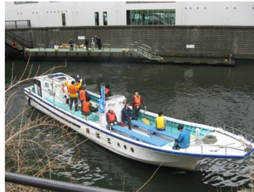
日本橋川の清掃に出発!