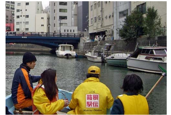
亀島川は護岸が低いこともあり、多くの船が係留されています。