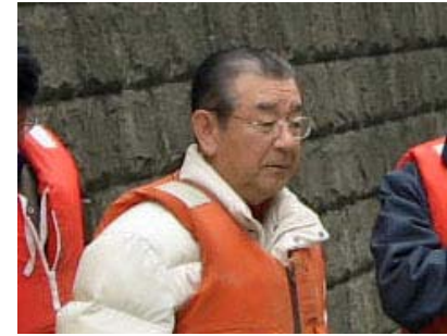
日本橋地域ルネッサンス100年計画委員会 橋本会長 挨拶