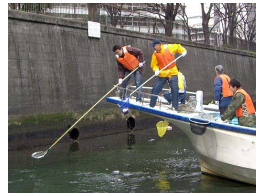
長い網と短い網。あうんの呼吸でゴミを拾います。