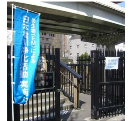
日本橋川浄化活動 実施中