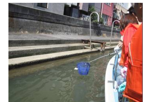
亀島川も掃除しました