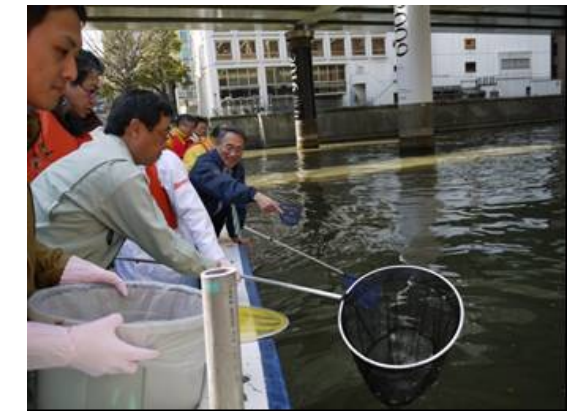
リーダーの指示のものと的確なオペレーション