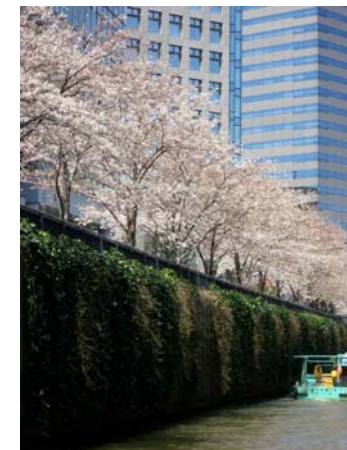
桜と護岸緑化のコラボレーション