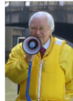
中央区矢田区長 挨拶