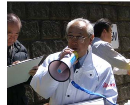
日本橋再生推進協議会 細田副会長 挨拶