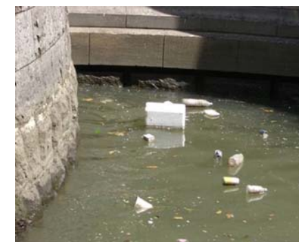
2日前に降った雨の影響で日本橋川は濁った状況でした。油分や汚物が下水管に付着した固形物のオイルボールもみられました。