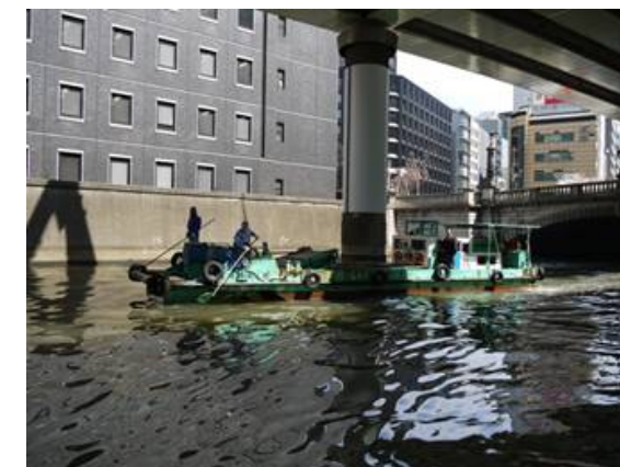
都の河川清掃船との協働作業