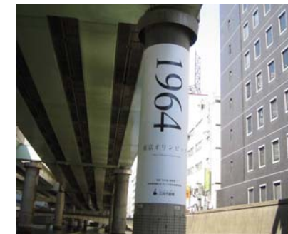
オリンピック誘致に向け橋脚も少しお化粧 ビジネスバックをゲット！！