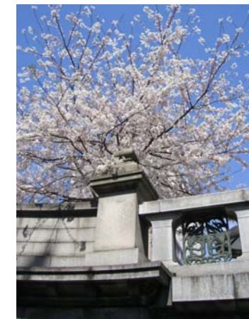
日本橋橋詰の桜も満開