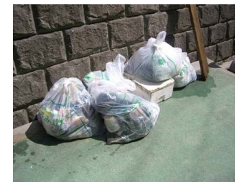
回収したごみの山