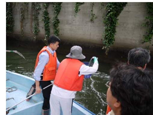
ごみは水を含んでいて重いです