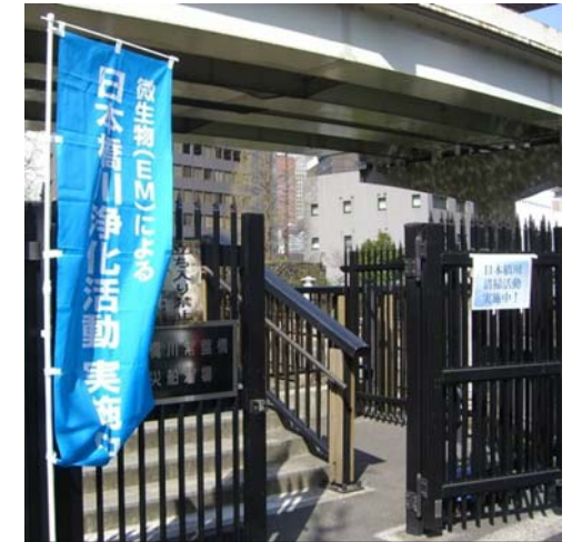
日本橋川浄化活動 実施中