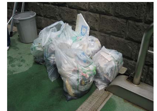
回収したごみの山