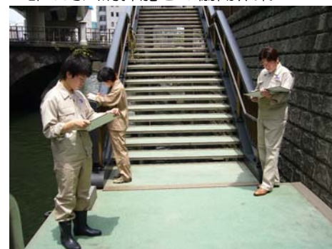
終了時にアンケートを記入