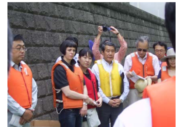
出発前のミーティング