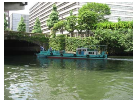
都の河川清掃船との協働作業