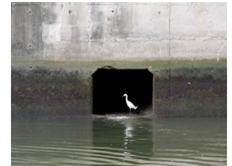
下水排水口でサギが休憩中