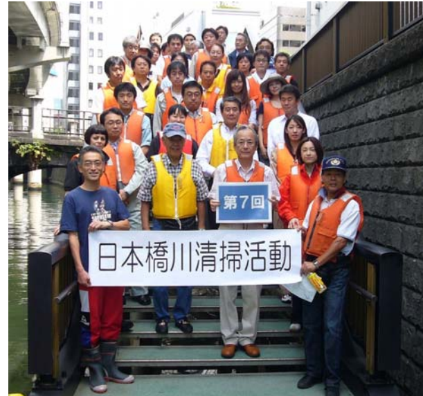
今回参加いただいた方々です