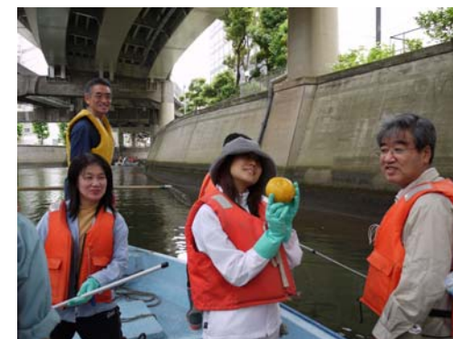
グレープフルーツ？