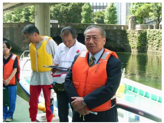
岩本三丁目町会長御挨拶