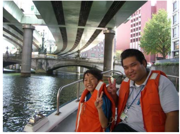
日本橋をバックに先生とツーショット