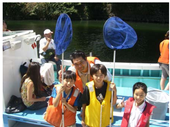
新沼先生と小学生