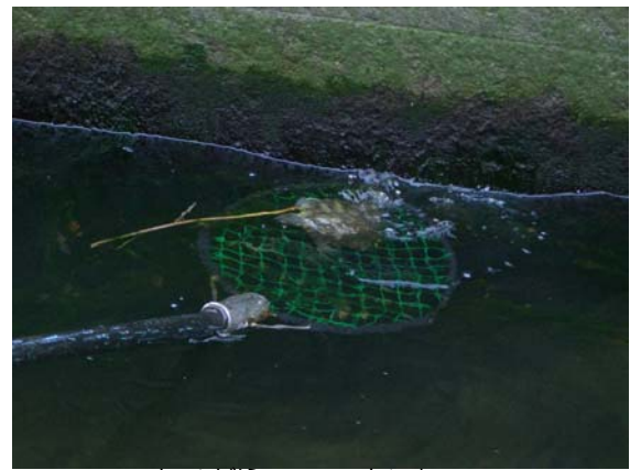
カメが泳いでいました