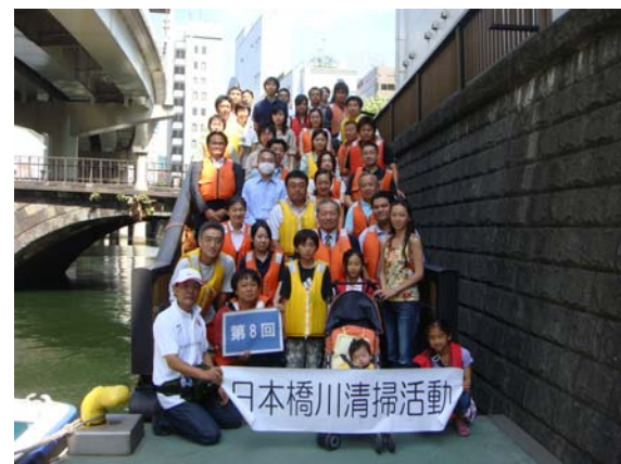
今回参加いただいた方々です