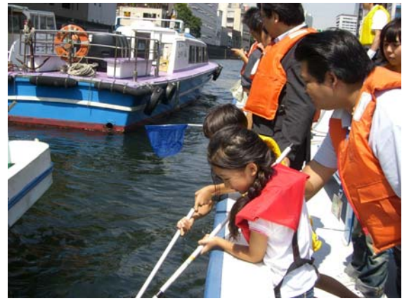
一所懸命にゴミをすくいます