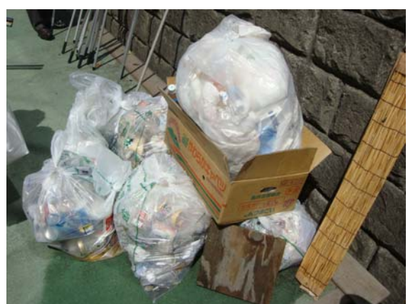
回収したごみの山