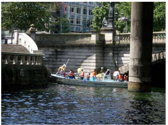
ゴミの溜まりやすい橋詰を丁寧に掃除