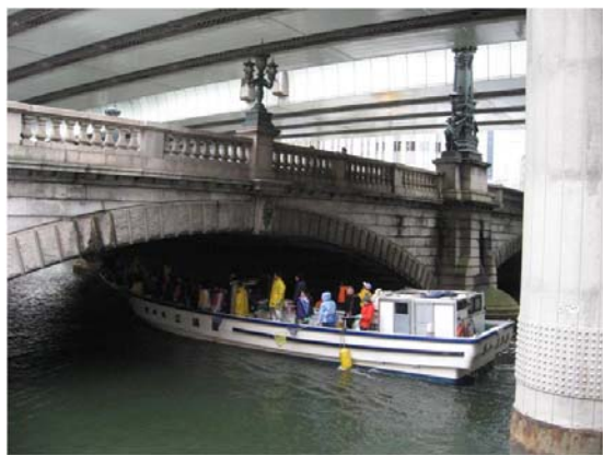
日本橋のまわりでもゴミをすくいます!