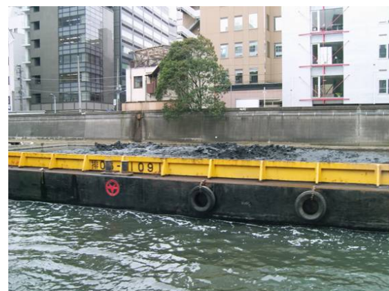
土運船に積まれた日本橋川の泥