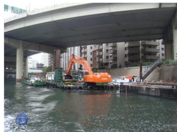
バックホウで浚渫をしていました。