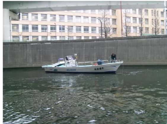
エンジントラブルでストップ