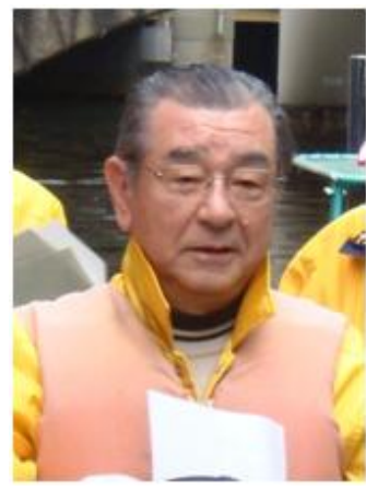
ルネッサンス橋本会長ご挨拶