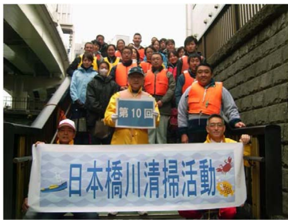
今回参加いただいた方々です