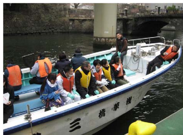
出発前の記念撮影