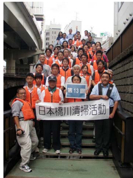
今回参加いただいた方々です