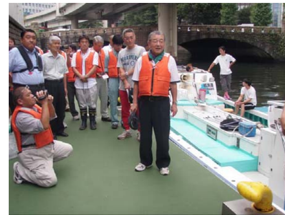
橋本ルネッサンス会長ご挨拶