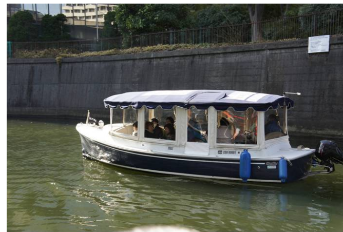
エコボートで日本橋川クルーズ中