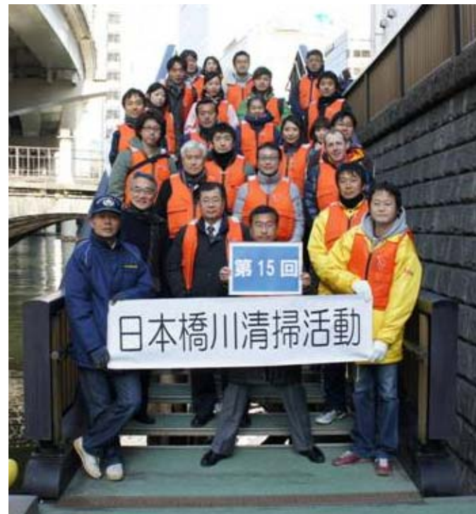
今回参加いただいた方々です