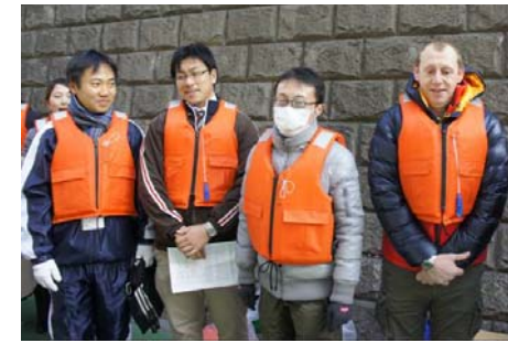
新たに参加頂いた方々です