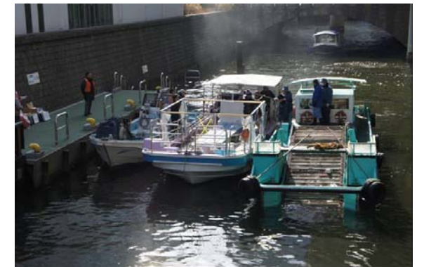
河川清掃に参加した船舶