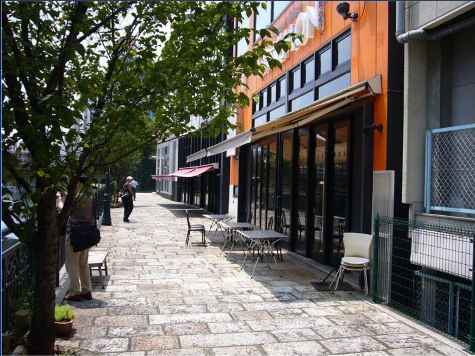
リバーウォークのカフェ