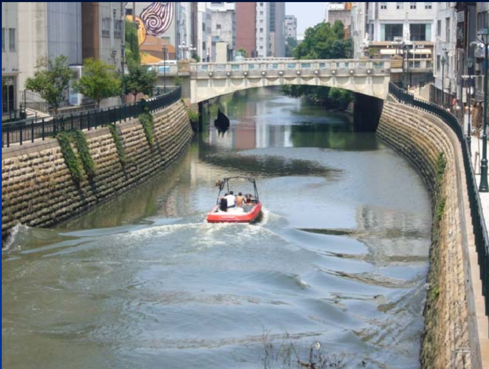
納屋橋から見た錦橋