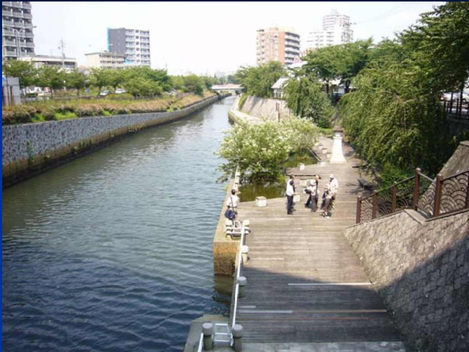
北清水橋付近のボードウォーク