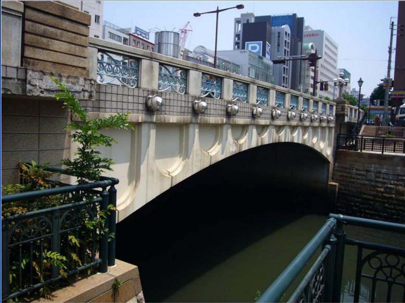
リバーウォークから見た錦橋