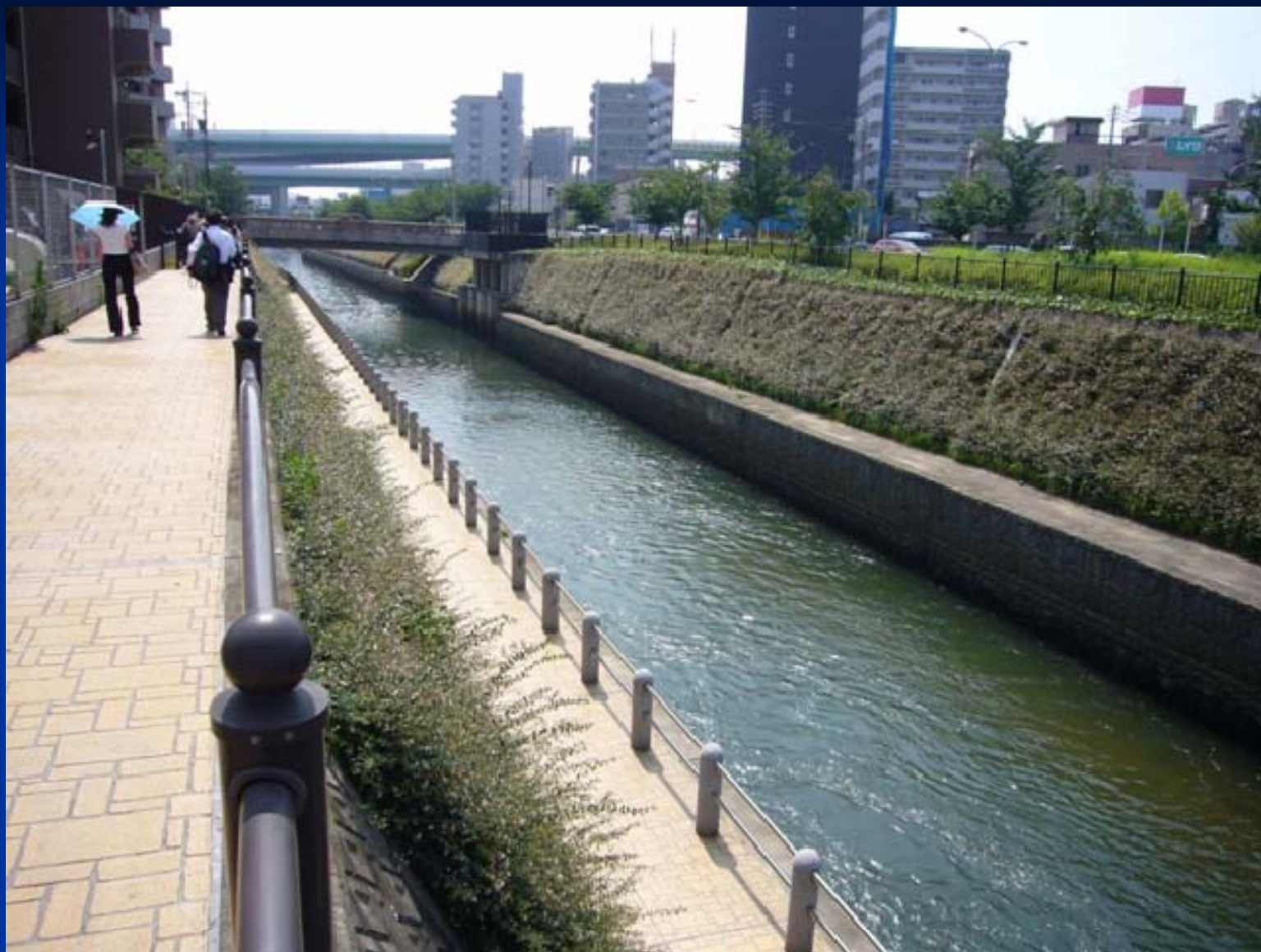
志賀橋付近の遊歩道