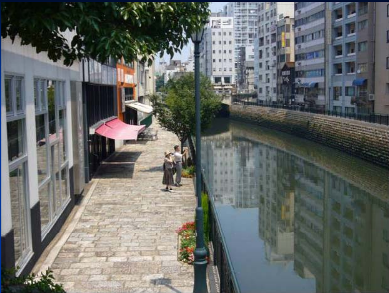
納屋橋から見たリバーウォーク